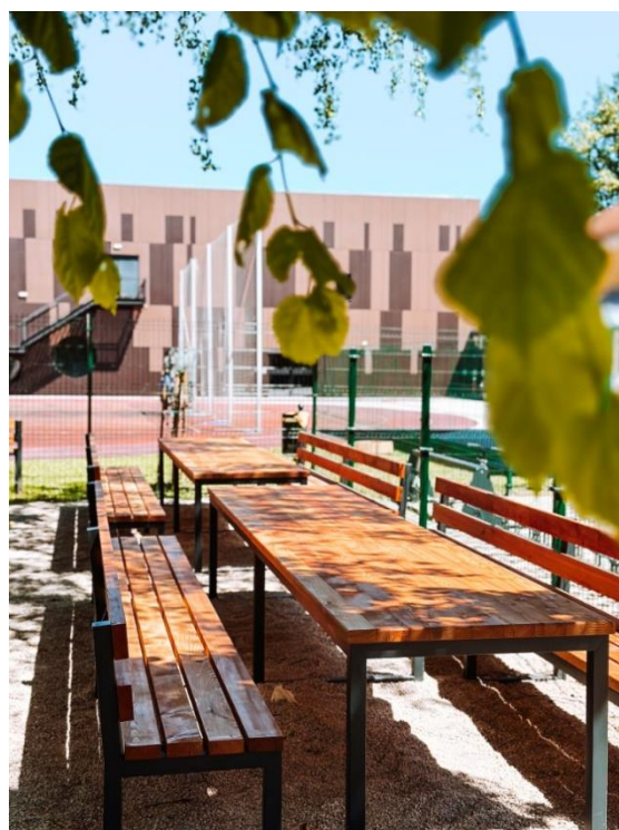
Nova pridobitev v letu 2024 – UČILNICA NA PROSTEM