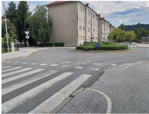
Slika 4: Prehod za pešce Kersnikova krožišče Previdno prečkam na prehodu za pešce.