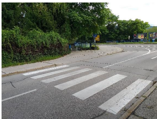
Slika 1: Podhod Vrunčeva Previdno prečkam na prehodu. V šolo grem skozi podhod.