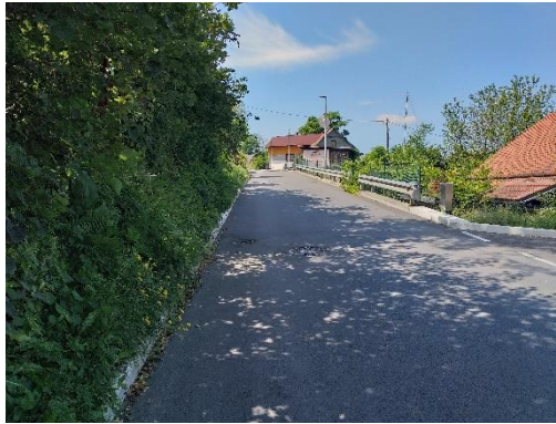
Slika 9: Nevaren odsek Kolškova Pločniki niso urejeni. Hodim previdno ob levem robu.