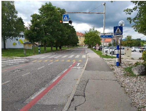
Slika 7: Prehod za pešce Vrunčeva Previdno prečkam na prehodu za pešce.