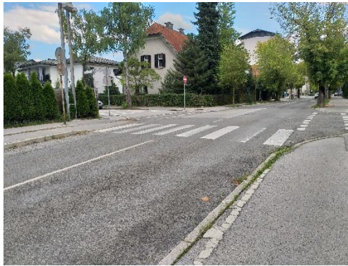
Slika 4: Prehod za pešce Kersnikova Previdno prečkam, ko se dobro prepričam da ni vozil.