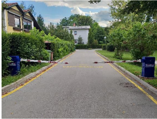
Slika 7: Intervencijska pot Vrunčeva Hodim previdno ob robu.