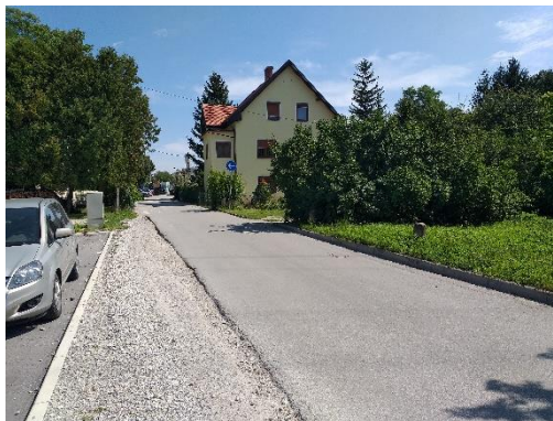
Slika 8: Nevaren odsek Kosova ulica Pločniki niso urejeni. Hodim previdno ob levem robu.