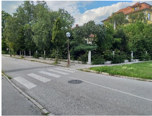
Slika 6: Prehod za pešce Oblakova 1 Previdno prečkam na prehodu za pešce.