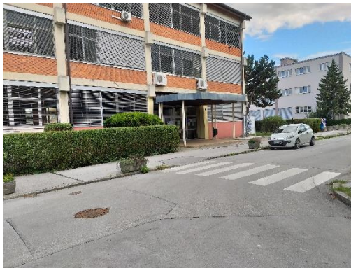
Slika 5: Prehod za pešce Kosovelova Previdno prečkam, ko se dobro prepričam da ni vozil.