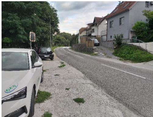
Slika 10: Nevaren odsek Teharska Pločniki se končajo.