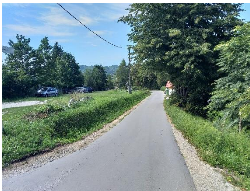
Slika 11: Nevaren odsek Mirna pot Pločniki niso urejeni. Hodim previdno ob levem robu.