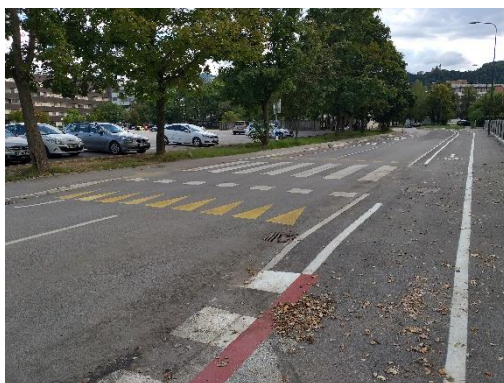
Slika 3: Prehod za pešce Vrunčeva Previdno prečkam, ko se dobro prepričam da ni vozil.