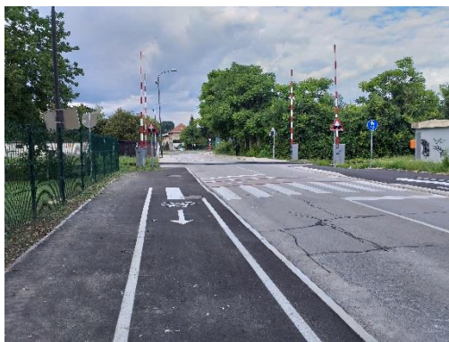
Slika 6: Prehod čez železniško progo Vrunčeva Progo prečkam samo kadar so zapornice dvignjene in ne gorijo rdeče luči.