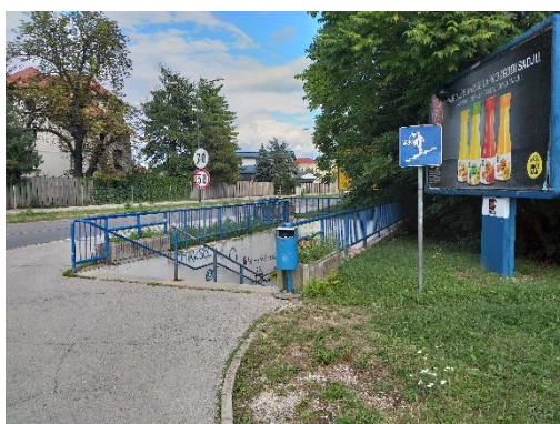
Slika 2: Podhod Ipavčeva V šolo grem skozi podhod.