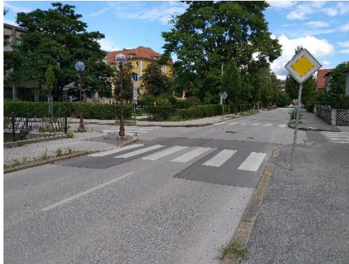
Slika 3: Prehod za pešce Oblakova Previdno prečkam na prehodu za pešce.