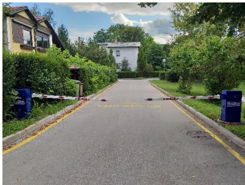
Slika 5: Intervencijska pot Vrunčeva Hodim previdno ob robu.